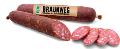
БРАУНВЕГ BRAUNWEG С/К П/С В/У Б/Т 71867