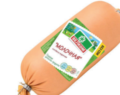
МОЛОЧНАЯ Б/О В/У 71992