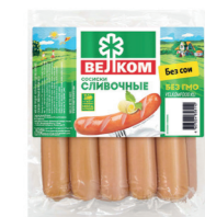
СОСИСКИ СЛИВОЧНЫЕ В/У 71784