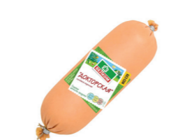
ДОКТОРСКАЯ Б/О В/У 70024