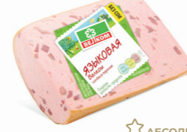
ЯЗЫКОВАЯ В/У КУСОК 70051