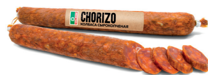
ЧОРИЗО CHORIZO С/К В/У Б/Т 71865