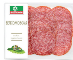
ВЕЛКОМОВСКАЯ С/К ГЭС 71723