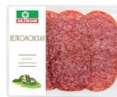
ВЕЛКОМОВСКАЯ С/К ГЭС 71745