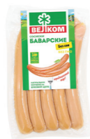
СОСИСКИ БАВАРСКИЕ В/У 70911