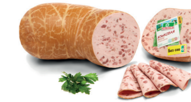
ЯЗЫКОВАЯ Н/О В/У 70049