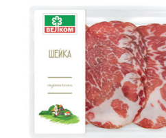
ШЕЙКА С/К ГЭС 71717