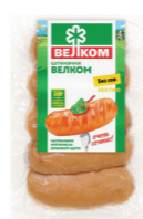
ШПИКАЧКИ Н/О В/У 70909