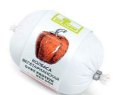
ВЕГЕТАРИАНСКАЯ С ПАПРИКОЙ 71763