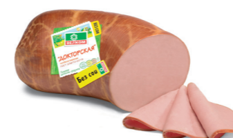
ДОКТОРСКАЯ Н/О В/У 70014