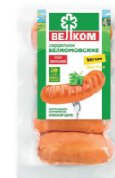
САРДЕЛЬКИ ВЕЛКОМ Н/О В/У 70901