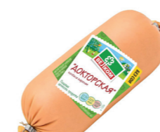
ДОКТОРСКАЯ Б/О В/У 71981