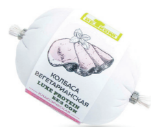
ВЕГЕТАРИАНСКАЯ КЛАССИЧЕСКАЯ 71762