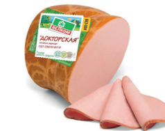
ДОКТОРСКАЯ Н/О В/У КУСОК 70015