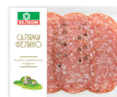
САЛЯМИ ФЕЛИНО С/К ГЭС 71884