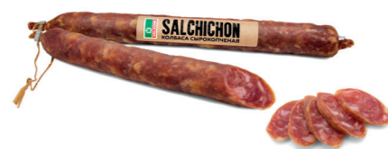
САЛЬЧИЧОН SALCHICHON С/К В/У Б/Т 71866