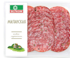
МИЛАНСКАЯ С/К ГЭС 71741