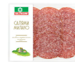
САЛЯМИ МИЛАНО С/К ГЭС 71886