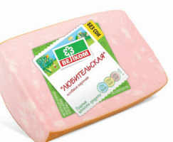
ЛЮБИТЕЛЬСКАЯ В/У КУСОК 70030