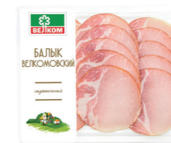
БАЛЫК ВЕЛКОМ С/К ГЭС 71718