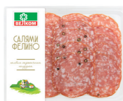
САЛЯМИ ФЕЛИНО С/К ГЭС 71885