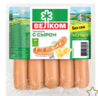
СОСИСКИ С СЫРОМ В/У 71940