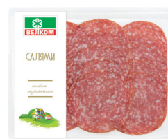
САЛЯМИ С/К ГЭС 71721