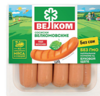
СОСИСКИ ВЕЛКОМ ГЭС 71962