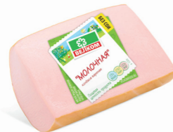
МОЛОЧНАЯ В/У КУСОК 71081