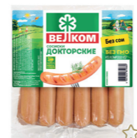
СОСИСКИ ДОКТОРСКИЕ В/У 70069