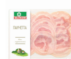
БЕКОН С/К ПАНЧЕТТА С/К ГЭС 71792