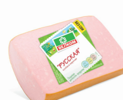
РУССКАЯ В/У КУСОК 71082