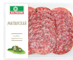
МИЛАНСКАЯ С/К ГЭС 71722