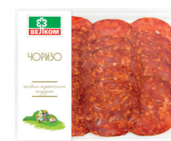
ЧОРИЗО С/К ГЭС 71882