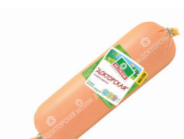
ДОКТОРСКАЯ Б/О В/У 70025