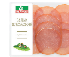
БАЛЫК ВЕЛКОМ С/К ГЭС 71988