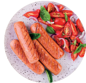
СОСИСКИ И САРДЕЛЬКИ