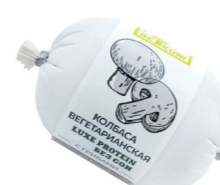
ВЕГЕТАРИАНСКАЯ С ГРИБАМИ 71764