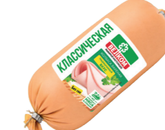
КЛАССИЧЕСКАЯ Б/О В/У 72015