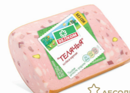
ТЕЛЯЧЬЯ В/У КУСОК 70047