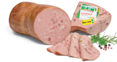
ТЕЛЯЧЬЯ Н/О В/У 70045