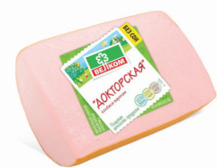
ДОКТОРСКАЯ В/У КУСОК 70020