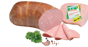
ЛЮБИТЕЛЬСКАЯ Н/О В/У 70028