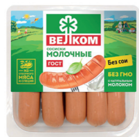
СОСИСКИ МОЛОЧНЫЕ ГЭС 71963