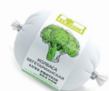
ВЕГЕТАРИАНСКАЯ С БРОККОЛИ 71765